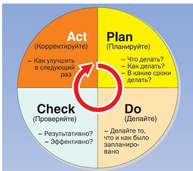
Рис.2. Цикл Деминга

Практический опыт внедрения систем управления качеством образования позволяет выделить основные стадии управления качеством (рис. 2):