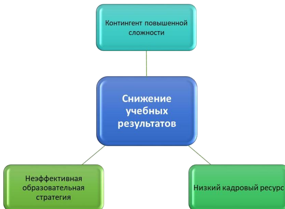
Рис. 1. Факторы снижения учебных результатов

Различные типы проблемности возникают на пересечении этих основных факторов (рис. 1).