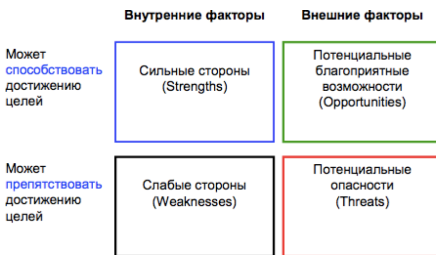
Рис. 4. Шаблон SWOT-анализа

SWOT-анализ деятельности школы помогает определить внешние и внутренние моменты, влияющие на успешную работу всего коллектива. К внутренним относятся сильные и слабые стороны образовательного учреждения, а к внешним – возможности для развития и угрозы нормальному функционированию.